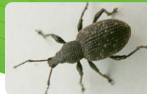
Gorgojo - Sitophilus spp